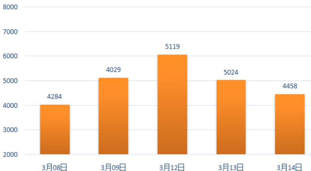
近五个交易日两市成交量

近两天我们对大盘的观点偏悲观，市场也走了和我们预期一致的技术调整走势，今天的市场各方数据如何？从主力资金的数据看，今日主力资金继续流出，流出额 231.5 亿，虽然较个交易日流出额减少 30 亿，但超 200 亿的流出仍表明了市场主流资金短期悲观情绪未见明显改善。值得注意的是，今日尾盘主力资金流出超 50 亿，该数据是 2018 年以来最大值，尾盘大量资金出逃或预示着短期行情不容乐观！