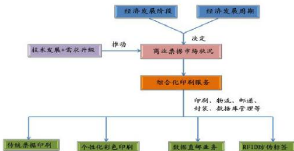
票据印刷业发展转型历程